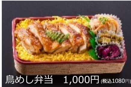
鳥めし弁当 1,000円 (税込1080円)