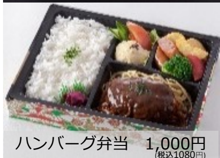
ハンバーグ弁当 1,000円 (税込1080円)