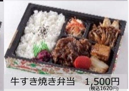
牛すき焼き弁当 1,500円 (税込1620円)