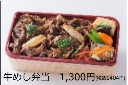
牛めし弁当 1,300円 (税込1404円)