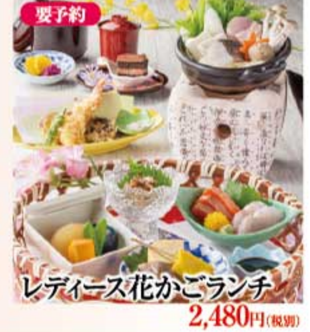
レディース花かごランチ 2,480円(税別)

お願い 事前にお席・お料理をご用意させて頂いておりますので、前日午前中までにご予約下さいませ。 お席はテーブル・イス席をご用意。完全個室にはならない場合がございます。予めご了承下さい 上記メニューはランチ時間限定のご優待内容となっておりますので、この機会にご賞味下さいませ。