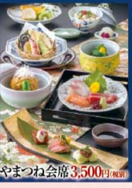
やまつね会席 3,500円(税別)