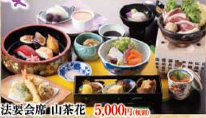
法要会席 山茶花 5,000円(税別)