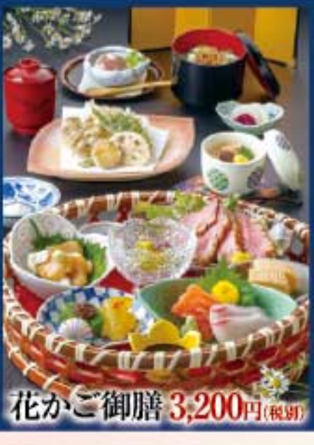
花かご御膳 3,200円(税別)