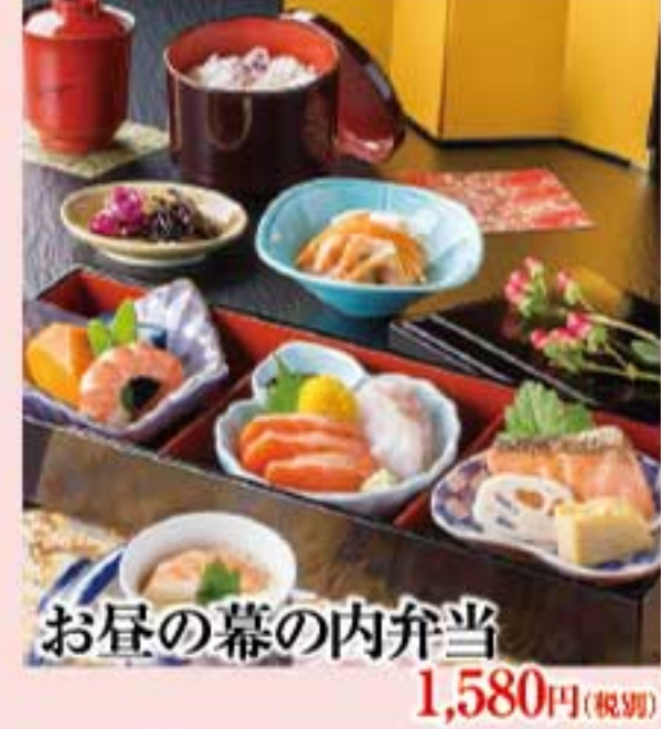
お昼の幕の内弁当 1,580円(税別)