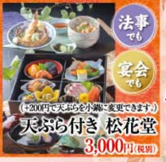
法事でも 宴会でも (+200円で天ぷらを小鉢に変更できます) 天ぷら付き 松花堂 3,000円(税別)