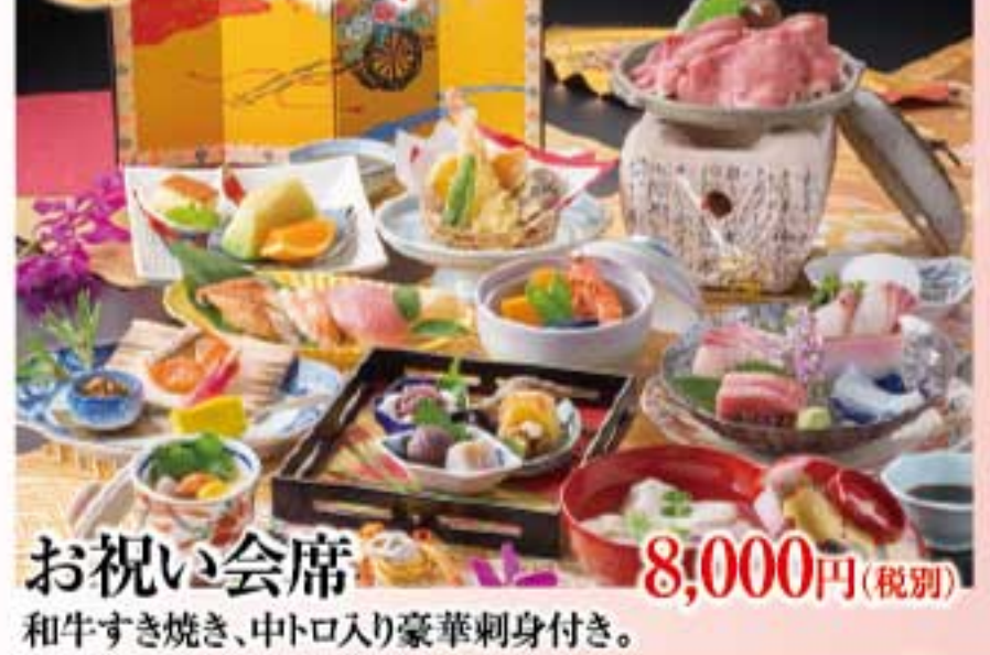
お祝い会席 8,000円(税別) 和牛すき焼き、中トロ入り豪華刺身付き。