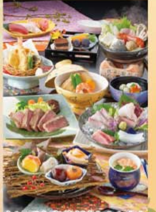
中トロ入り豪華刺身とやわらかステーキ会席 7,800円(税別)