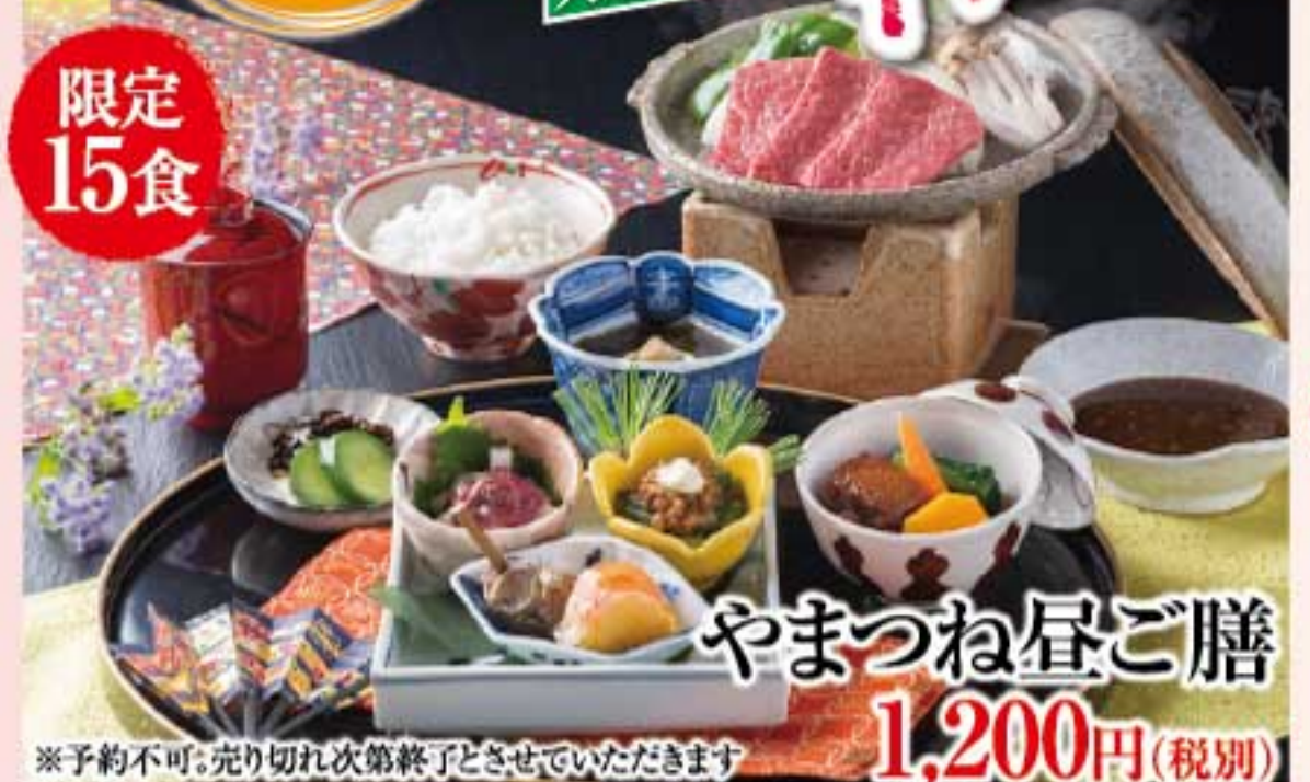
やまつね昼ご膳 1,200円(税別) ※予約不可。完り切れ次第終了とさせていただきます

ご来店いただく皆様から大好評をいただいております「山常楼のランチ」。秋は気候も穏やかになり、お昼からお集まりになるのはいかがでしょうか。女性が召し上げりやすいメニューも多く、楽しい美味しいお昼の時間をご用意しております。