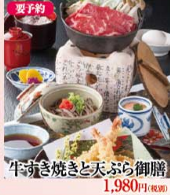
牛すき焼きと天ぷら御膳 1,980円(税別)