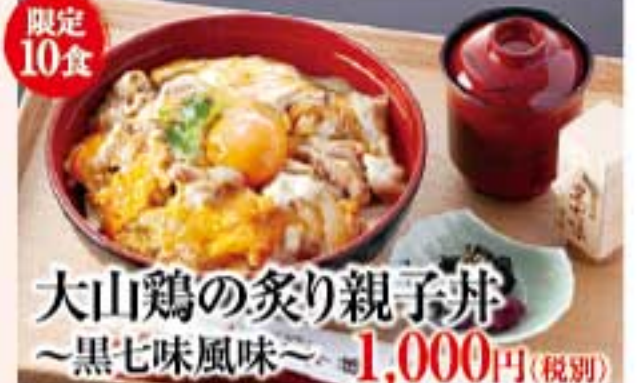
大山鶏の炙り親子丼 ~黒七味風味~ 1,000円(税別)