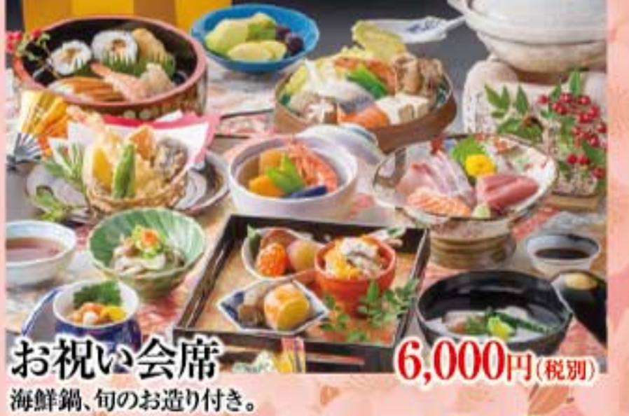
お祝い会席 6,000円(税別) 海鮮鍋、旬のお造り付き。