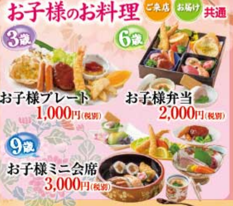
お子様のお料理 3歳 6歳 9歳 お子様プレート 1,000円(税別) お子様弁当 2,000円(税別) お子様ミニ会席 3,000円(税別)