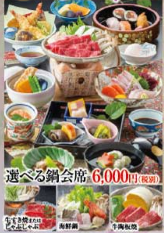
選べる鍋会席 6,000円(税別)