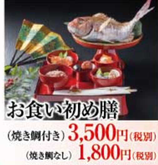
お食い初め膳 (焼き鯛付き) 3,500円(税別) (焼き鯛なし) 1,800円(税別)