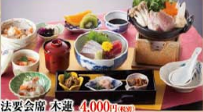
法要会席 木蓮 4,000円(税別)