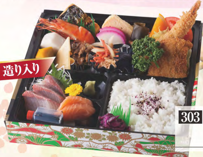
303 雪の内 1,500円(税別)