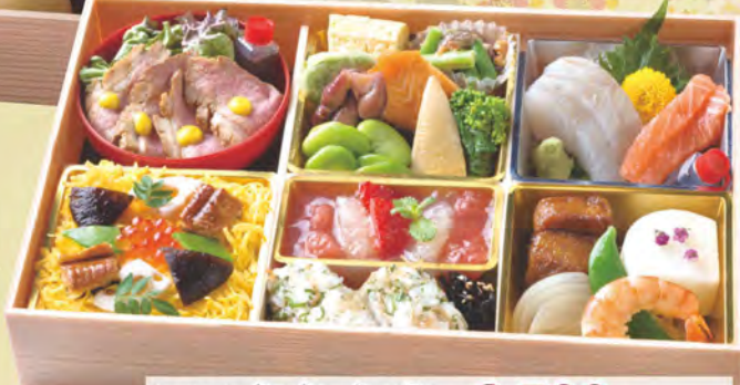
306 春色弁当 2,500円(税別) 造り、前菜、合鴨コース煮、ちらし寿司、炊き合わせ、果物ゼリー寄せ