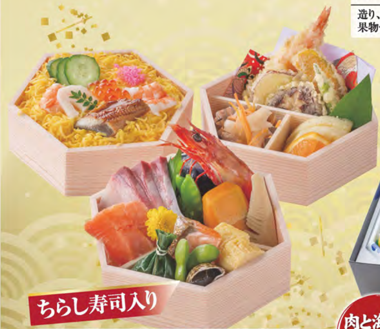
301 みやび弁当 2,200円(税別) 造り、前菜、ちらし寿司、天ぷら、酢の物、炊き合わせ、果物