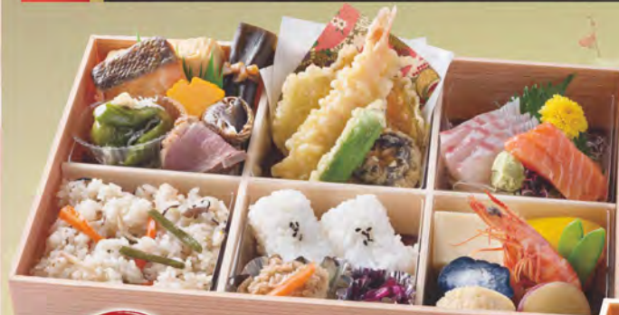
305 四季彩弁当 2,000円(税別) 造り、前菜、焼物、季節御飯、天ぷら、炊き合わせ