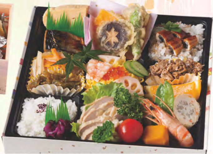
310 やまつね九折弁当 1,700円(税別)