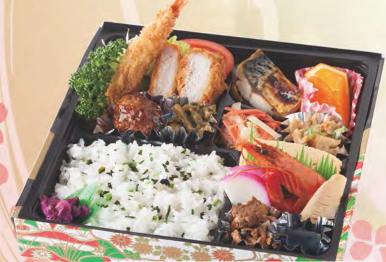
311 雪の内 1,250円(税別)