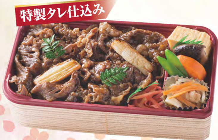
307 牛めし弁当 1,300円(税別)