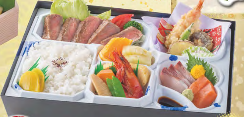
302 和牛ステーキ弁当 2,800円(税別) 和牛ステーキ、造り、天ぷら、前菜、果物