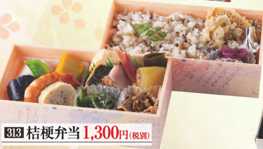
313 桔梗弁当 1,300円(税別)